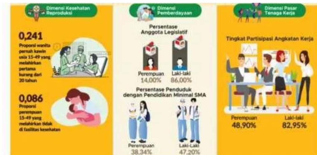
Gambar 2. Indeks Ketimpangan Gender (IKG) Provinsi Banten Tahun 2024

mereka memiliki simbol dengan makna tertentu untuk lebih dekat dengan yang diwakilinya. Dari penjelasan empat bentuk representasi inilah yang akan digunakan penulis untuk memahami pola yang terjadi di Provinsi Banten (Fitrianti, et al, 2023). Dengan memfokuskan pada representasi Perempuan dalam eksekutif seperti Kepala Daerah.